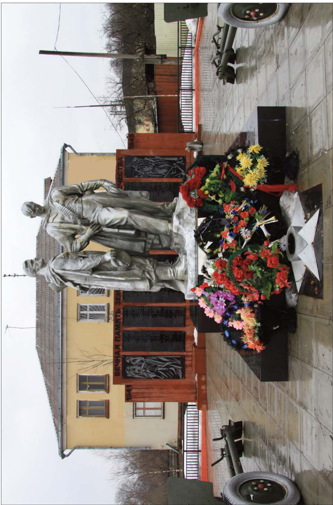
Мемориал памяти землякам – защитникам Отечества в селе Павловская Слобода