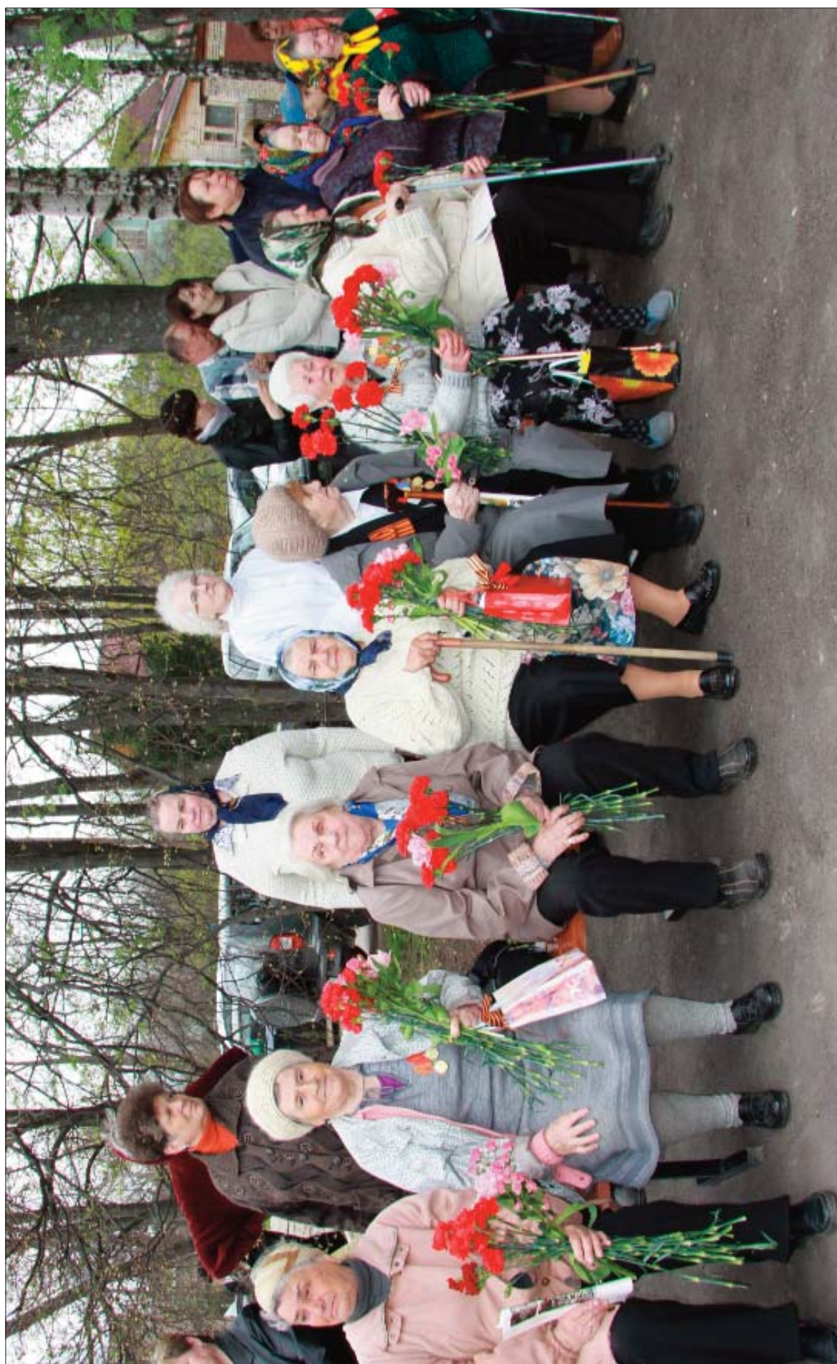
Ветераны Великой Отечественной войны. Село Рождествено. День Победы. 2011 год