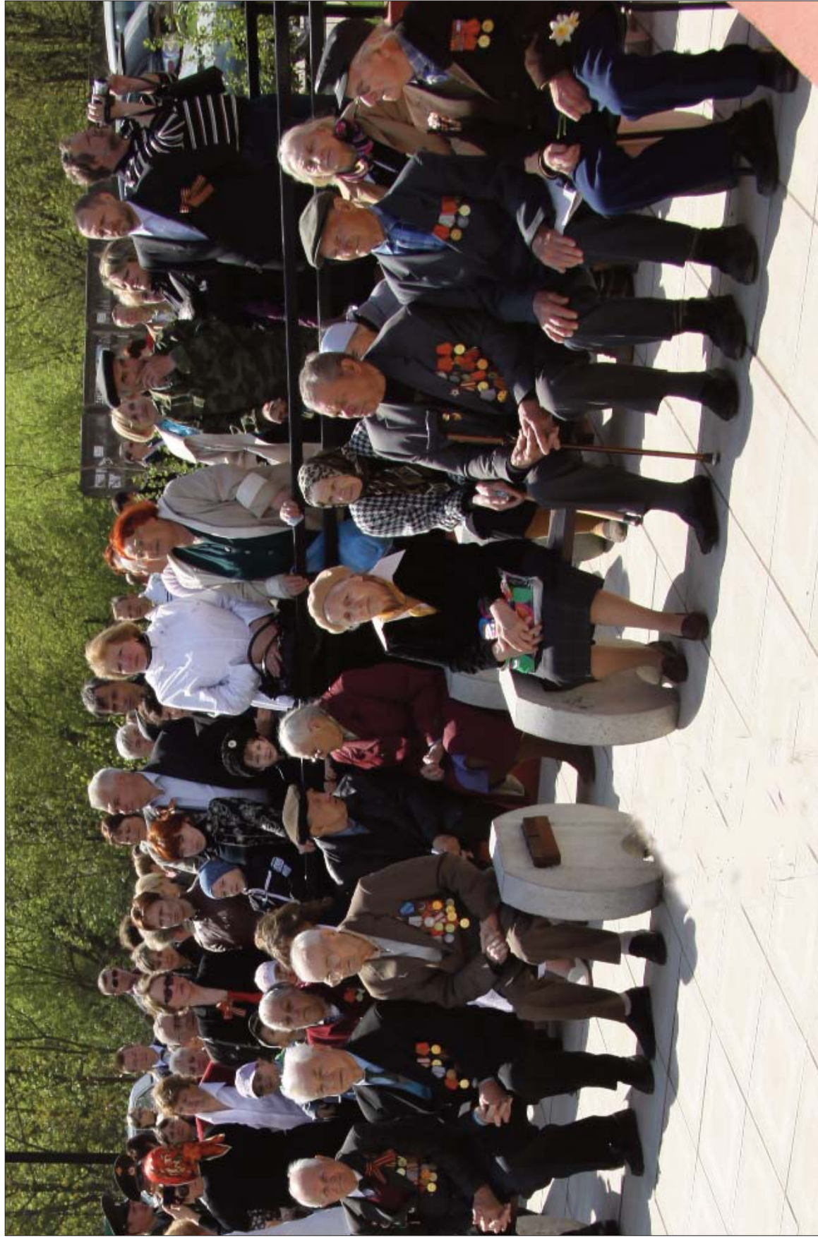
Ветераны Великой Отечественной войны. Село Павловская Слобода. День Победы. 2011 год