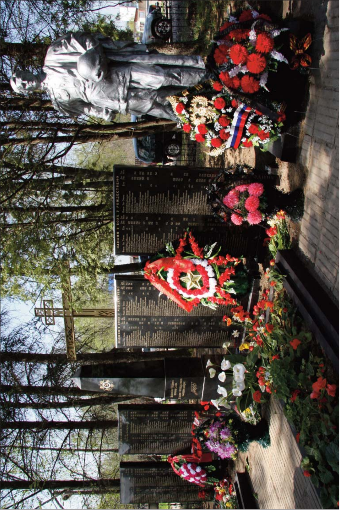
Братская могила погибших воинов в селе Рождествено